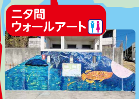
ニタ間ウォールアート

スタート受付 9:00~11:40 安房天津駅改札前 マップをお受け取りください。