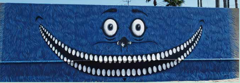
鴨川ウォールアート

※特典はすべて「駅からハイキング」参加当日に限り受けられます。 ※スタート駅とゴール駅が異なります。 ※鴨川シーワールドの入館は有料となります。